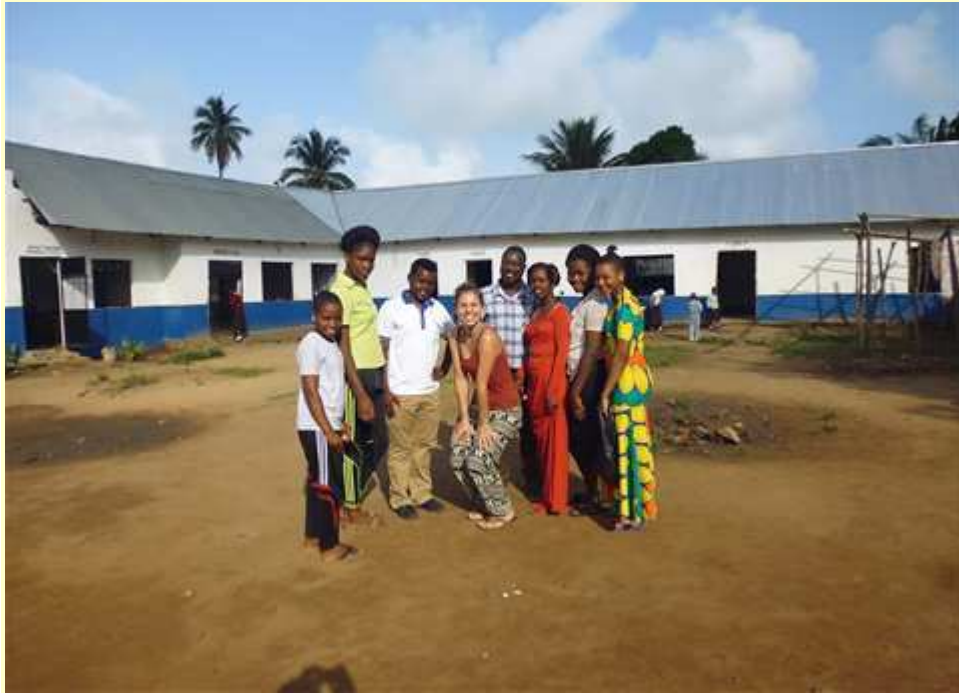
Het hele leerkrachtenteam

De laatste maanden waren echt bij de zotste uit mijn leven. Ik kan moeilijk geloven hoe dat allemaal zo goed is kunnen verlopen. Hoe de mensen hier mij zo snel in hun hart hebben gesloten en hoe ze mij zo welkom hebben doen voelen. Zoveel vriendelijke gezichten en zoveel goede bedoelingen.