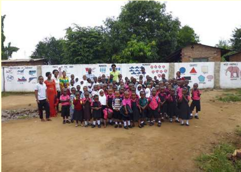
de hele school

Vandaag zijn we zondag. Het is vreselijk warm vandaag en ik zit alweer te zweten. Ik heb een baaldagje. Of een rouwdagje, dat is misschien beter gezegd. De familie hier gaat op familiebezoek en ze vroegen of ik zin had om mee te gaan. Ah, superleuk en op gelijk welk ander moment had ik ja gezegd, maar vandaag niet. Vandaag wil ik gewoon alleen zijn met mijn trieste afscheidsgedachten en mooie herinneringen over de afgelopen maanden hier in Ifakara en op het schooltje.