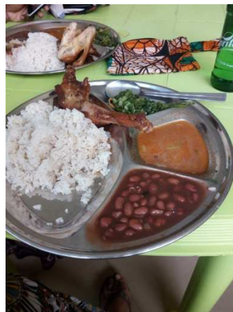
luxe-eten op vrijdagavond